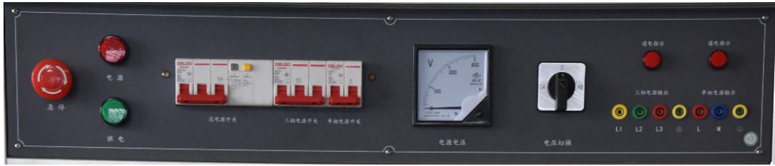
图 2 电源控制屏