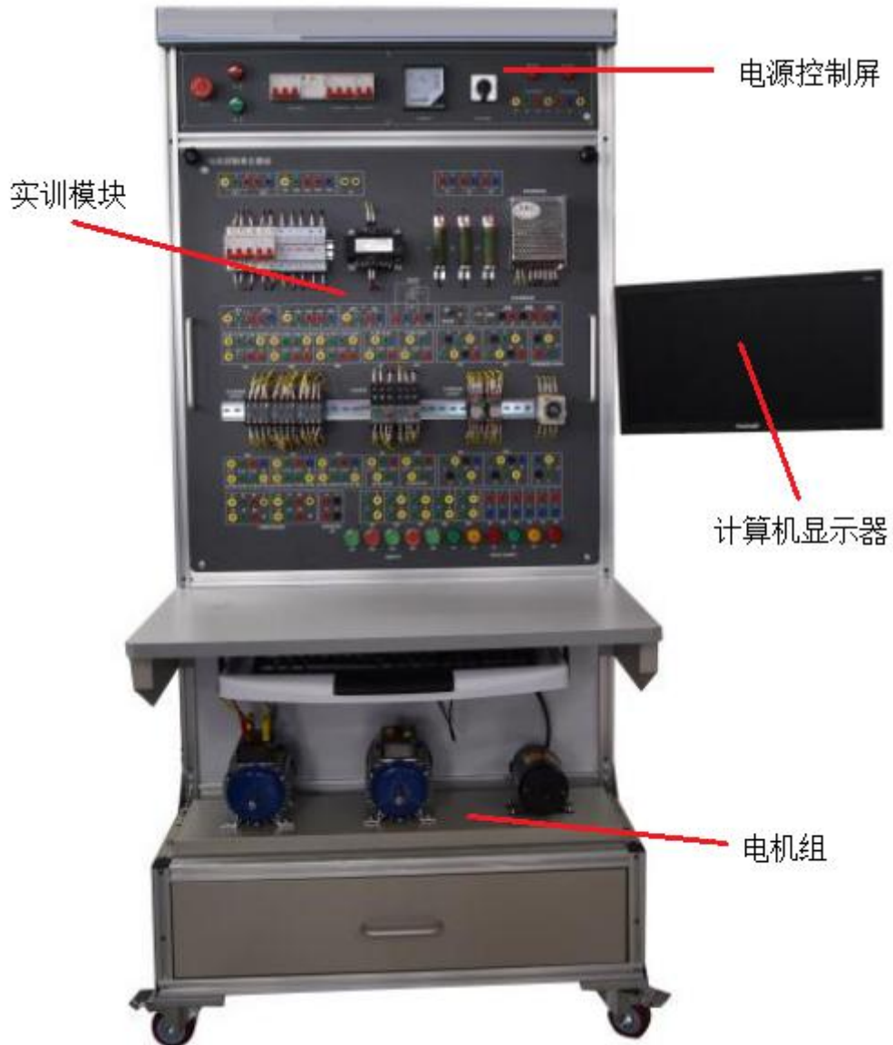
图 1 设备结构

山东省 2022 年春季高考自动控制类专业技能测试技能考核设备如图 1 所示，由电源控制屏、实训模块、电机组、计算机等组成。