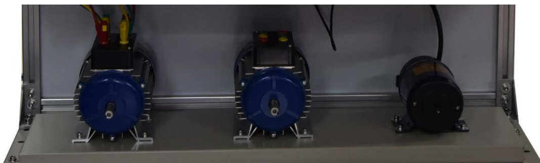
图 4 电机组